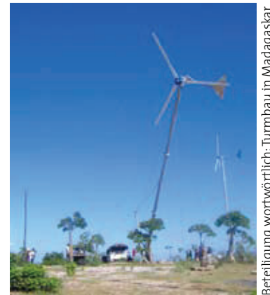
Beteiligung wortwörtlich: Turmbau in Madagaskar