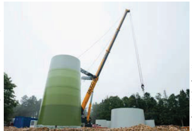
Turmbau in Le Peuchapatte