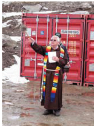
Höchster Segen für den höchsten Windpark