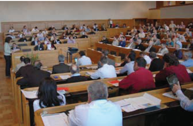
Dialog mit 200 Personen im Berner Rathaus