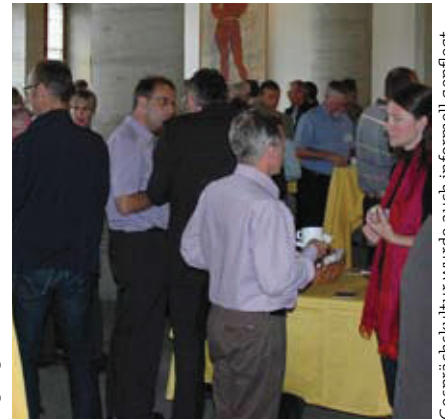
Gesprächskultur wurde auch informell gepflegt