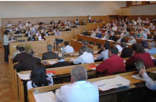
Dialog mit 200 Personen im Berner Rathaus