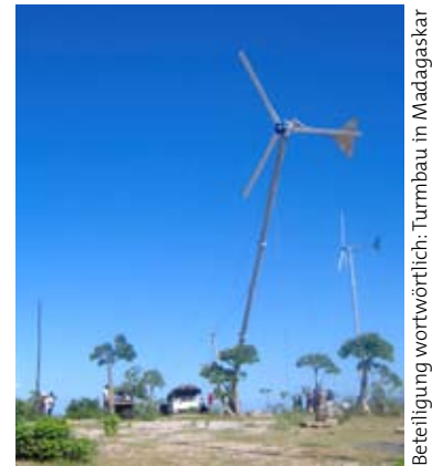
Beteiligung wortwörtlich: Turmbau in Madagaskar