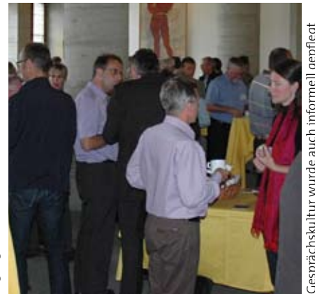
Gesprächskultur wurde auch informell gepflegt