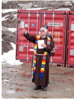
Höchster Segen für den höchsten Windpark