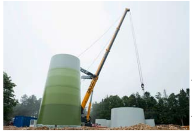
Turmbau in Le Peuchapatte